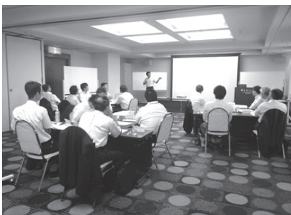
<上級管理者実践コース>