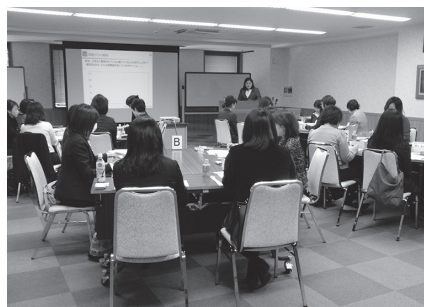
<女性リーダー・管理職養成セミナー>