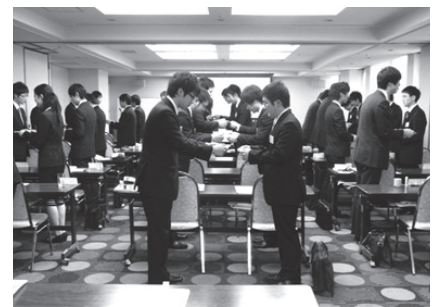
<フレッシュ・セミナー(新入社員研修)>